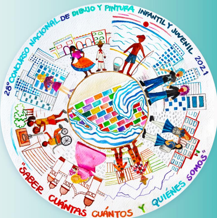
Dibujos: Ceiba Sultán, Oaxaca.