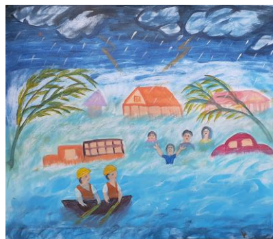
Autor: María Regina Chuc Pech, 2020.