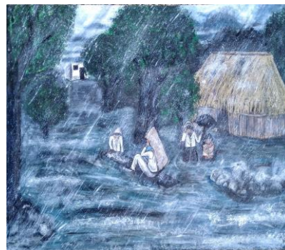
Autor: Maritza Alejandra Puc Pech, 2020.