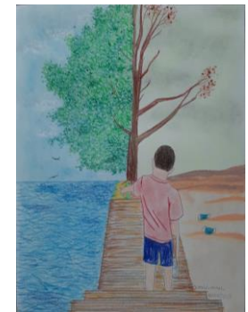
Autor: Oswaldo Novelo Rosado, 2020.

Los ganadores de este concurso se podrán consultar directamente a través de la página web: coespo.yucatan.gob.mx